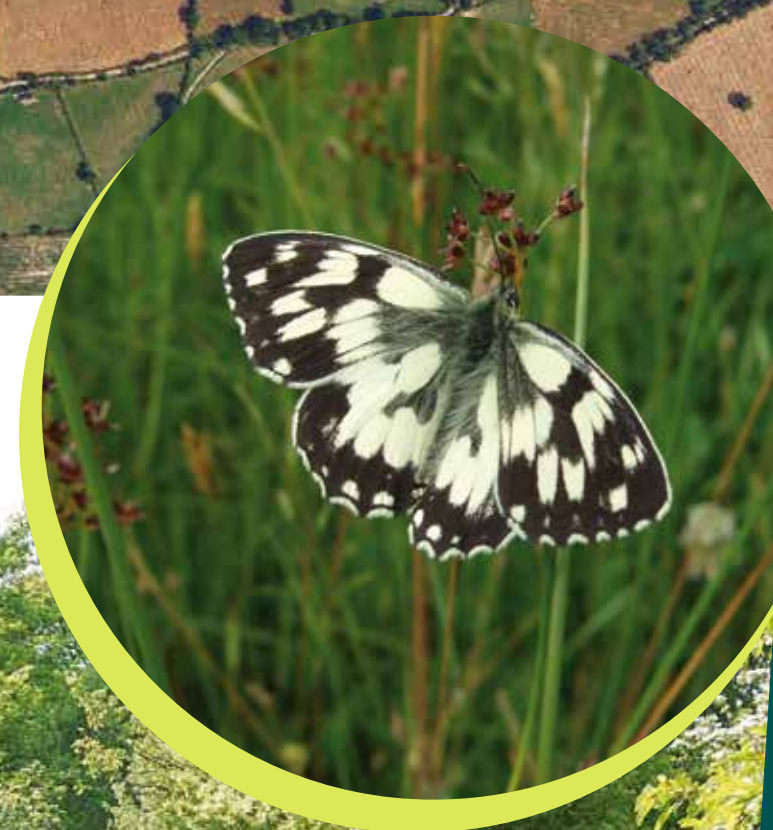
Domaine des Pêchoirs