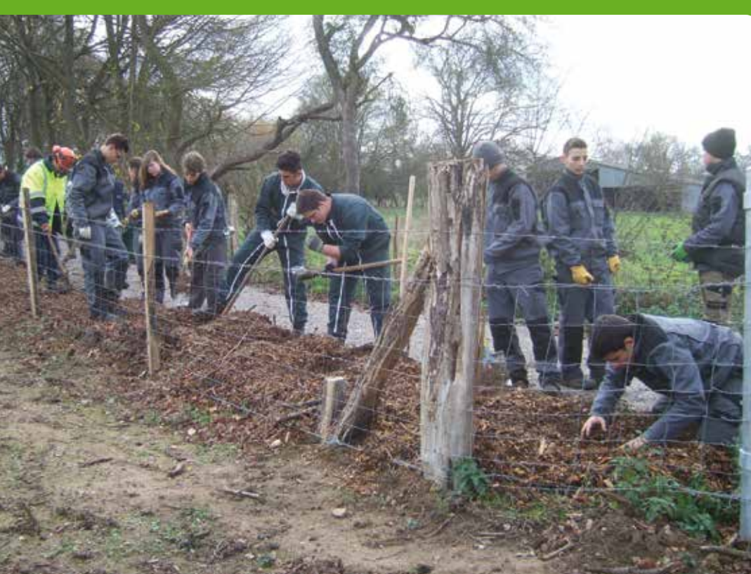
Chantier école de plantation avec le lycée de Neuvy