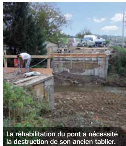
La réhabilitation du pont a nécessité la destruction de son ancien tablier.

implantés aux extrémités du pont sur lesquels il repose). Jusqu'à la fin du chantier, une déviation locale est mise en place sur la route départementale 401. Il est recommandé aux automobilistes de bien respecter la signalisation en place, en particulier les limitations de vitesse. En effet, en raison de l'étroitesse de cette voie, des créneaux ont été réalisés pour faciliter le croisement des véhicules. ■