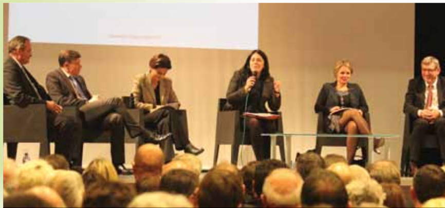
Le 7 novembre, Sylvia Pinel et Najat Vallaud-Belkacem, ministres, ont assisté à l'atelier des Assises de la ruralité organisé dans l'Allier.

L'organisation des Assises des ruralités vise, entre autres, comme l'évoquait le Premier ministre dans l'un de ses discours, à répondre au défi des Nouvelles ruralités. Cela fait directement écho à la démarche du même nom mise en place au sein de l'Assemblée des Départements de France. L'Allier, à l'origine de cette initiative, aux côtés du Cher, de la Creuse, et de