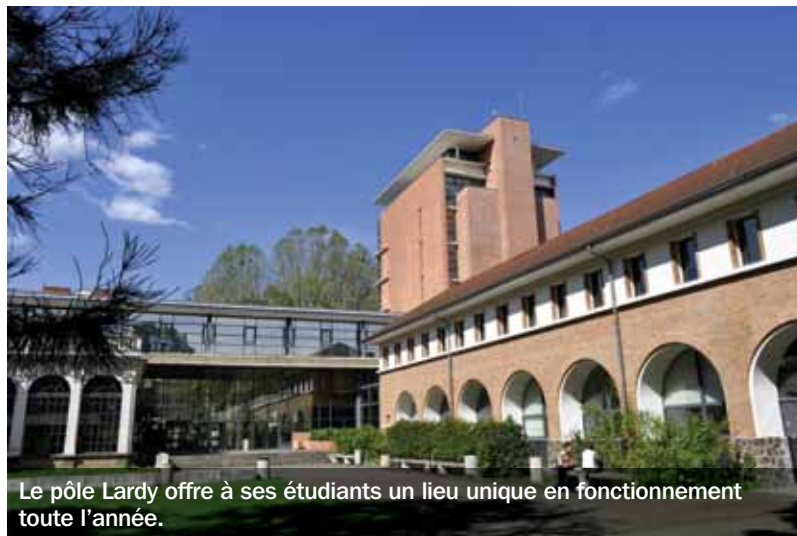
Le pôle Lardy offre à ses étudiants un lieu unique en fonctionnement toute l'année.

Ancienne friche thermale, le pôle Lardy, entre parcs et rivière, a aujourd'hui des allures d'Oxford à la française, où se côtoient 800 élèves du monde entier, dans une vie étudiante vivifiante. En une douzaine d'années, cette antenne délocalisée des universités de Clermont I et II, aussi appelée campus Albert-Londres, a su apporter une réponse offensive au développement économique local, en favorisant les formations innovantes et professionnalisantes. Dans les domaines de la communication, du multimédia, de la santé, des langues et du commerce international, Vichy s'est fait un nom en s'appuyant sur son savoir-faire local et attire de plus en plus d'étudiants extérieurs à la région. Réunissant en ses murs l'Université d'Auvergne, l'Université Blaise-Pascal et le Cavilam, le pôle Lardy offre donc