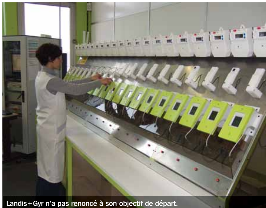
Landis+Gyr n'a pas renoncé à son objectif de départ.

Si Landis+Gyr trouve l'assurance de maintenir son activité grâce à la fabrication des premiers Linky®, l'entreprise a réactualisé ses projets pour son site montluçonnais. « Nous n'avons pas une vision suffisamment