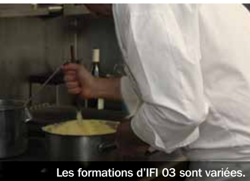
Les formations d'IFI 03 sont variées.

Tous les ans, plus de 900 apprentis franchissent le seuil de l'Institut de formation interprofessionnel de l'Allier (IFI 03). Créé à l'initiative de la Chambre de métiers et de l'artisanat, de la Chambre de commerce et d'industrie (CCI) et des collectivités locales, il a comme principal financeur le Conseil régional. IFI 03 accueille principalement des 16-25 ans, en contrat d'apprentissage avec