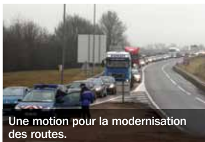
Une motion pour la modernisation des routes.

collèges 2016-2021 ont été également votées. De 2017 à 2021, le Conseil général consacrera annuellement 7,5 M€ à la rénovation des établissements (notamment thermique) et à leur modernisation. Par ailleurs, 5 motions ont été adoptées. D'une même voix, l'Assemblée départementale a entre autres demandé la revalorisation du volet « mobilité » du futur Contrat de plan État-Région pour la modernisation des infrastructures routières et ferroviaires de l'Allier. Les élus ont également demandé au Gouvernement de reporter après les élections de mars 2015 la lecture du projet de loi sur l'organisation territoriale pour laisser plus de temps à sa mise en place. ■