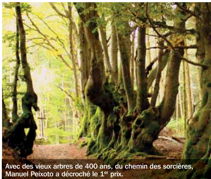
Avec des vieux arbres de 400 ans, du chemin des sorcières, Manuel Peixoto a décroché le 1 er prix.

Pour ces fêtes de fin d'année, le mij (musée de l'illustration jeunesse) et le mab (musée Anne-de-Beaujeu) sortent de leur hotte une kyrielle d'animations. Au mij, les plus jeunes sont les rois de la fête. Les 4-6 ans sont attendus les 23 et 30 déc, dès 10 heures, pour des lectures et un atelier ; les 7-10 ans, le 24 déc, à 10 heures (lecture-atelier) et le 30 déc, à 14 h 30 (lectures). Le mab pense aussi aux enfants : les 4-6 ans sont invités à réaliser une carte de Noël, le 23 déc, à 14 h 30, et les 7-12 ans pourront participer à un atelier artistique les 23 et 30 déc, à 10 heures, ou à une visite-lecture, le 24 déc, à 14 h 30. Les réservations sont conseillées et une participation financière sera demandée pour les ateliers. Les grands seront également choyés au mab, le 17 déc, à 18 heures, avec une conférence de Neil Stratford, conservateur général émérite du British Museum, sur l'email de saint Joseph. Bien entendu, il est aussi possible de voir les expositions, de participer aux visites de la Maison Mantin... On peut même faire ses achats de Noël, puisque les musées déclinent de nombreux objets dérivés. ■ • mij, 36, rue Voltaire 03000 Moulins www.mij.allier.fr • mab, place du Colonel Laussedat, 03000 Moulins www.mab.allier.fr