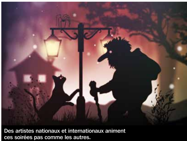
Des artistes nationaux et internationaux animent ces soirées pas comme les autres.