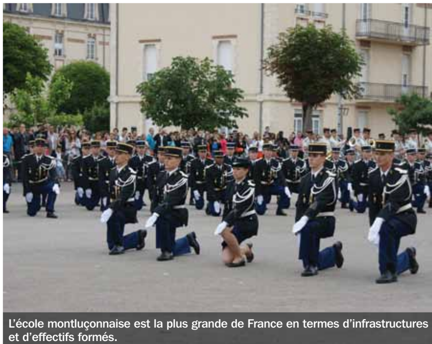
L'école montluçonnaise est la plus grande de France en termes d'infrastructures et d'effectifs formés.

Ouverte le 1 er août 1976, l'école montluçonnaise est la plus grande de France en termes d'infrastructures et d'effectifs formés. Elle est aussi