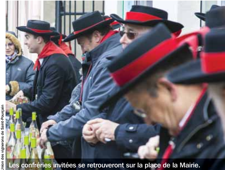
Union des vignerons de Saint-Pourçain

Les confréries invitées se retrouveront sur la place de la Mairie.