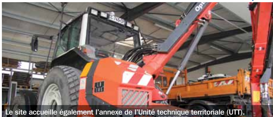
Le site accueille également l'annexe de l'Unité technique territoriale (UTT).

Cet automne, le Département de l'Allier a inauguré les nouveaux locaux de son Centre technique d'exploitation de la route (CTER) de Moulins-Auvernes, chargé de l'entretien des routes départementales. Il accueille aussi l'annexe de l'UTT de Dompierre/Moulins, chargée de la gestion du domaine routier, d'études et du suivi de travaux.