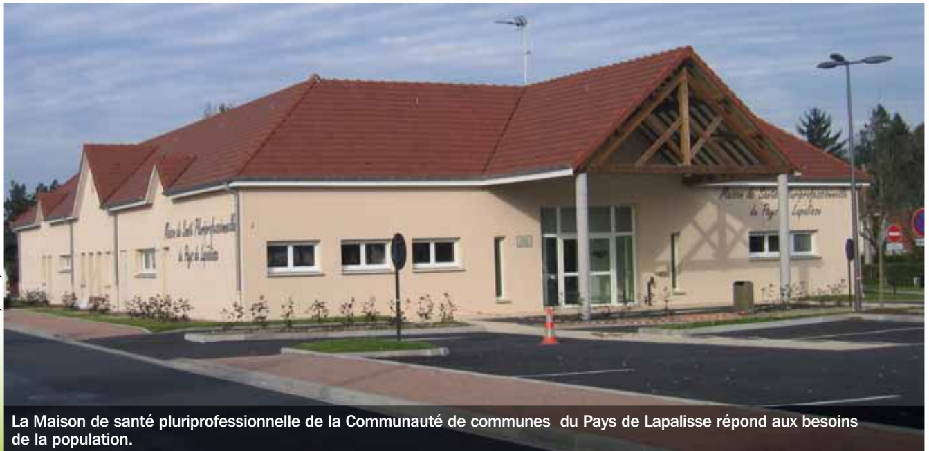
Communauté de communes du Pays de Lapalisse