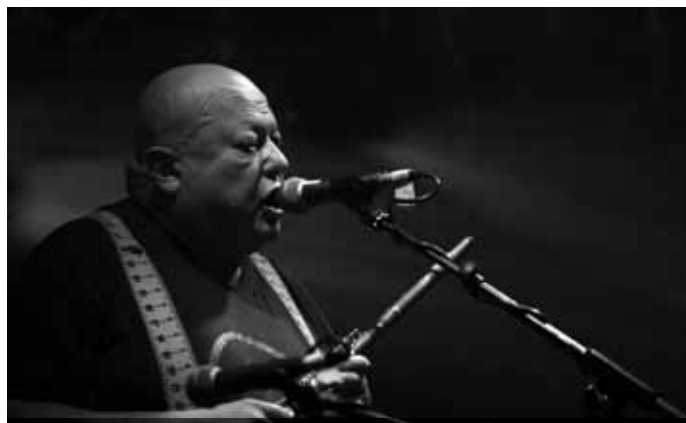
Pigalle par Henri Fronty

Le label national permet d'avoir des têtes d'affiche nationales.