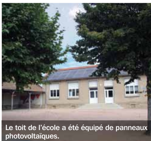
Le toit de l'école a été équipé de panneaux photovoltaïques.