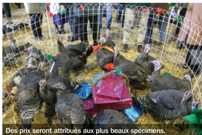
Des prix seront attribués aux plus beaux spécimens.

► tél. 04 70 43 86 15 (réservation dindes) tél. 06 33 94 66 76 (réservation repas)