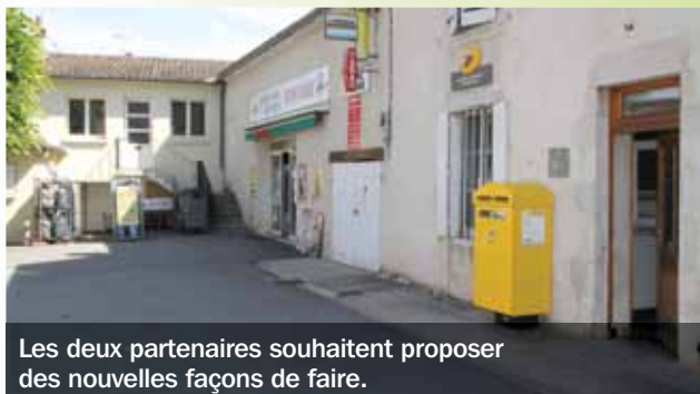
Les deux partenaires souhaitent proposer des nouvelles façons de faire.

Le Département de l'Allier a noué une convention de partenariat avec le Groupe La Poste, qui trouvera ses premières traductions en 2015 après la réalisation du schéma des services. En s'appuyant sur ce document, ils souhaitent conjointement travailler de concert à l'amélioration des services au public, dans l'Allier. Cette volonté rejoint la