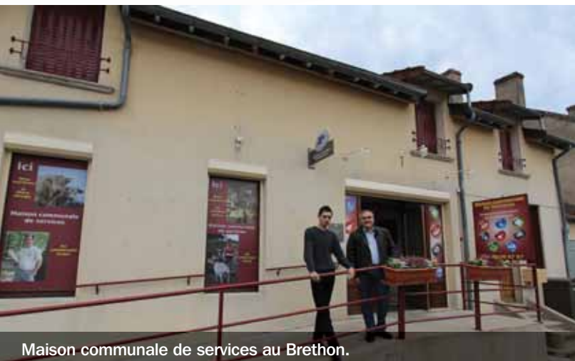
Maison communale de services au Brethon.

En suivant cette même logique, les ménages, qu'ils travaillent ou ●●●