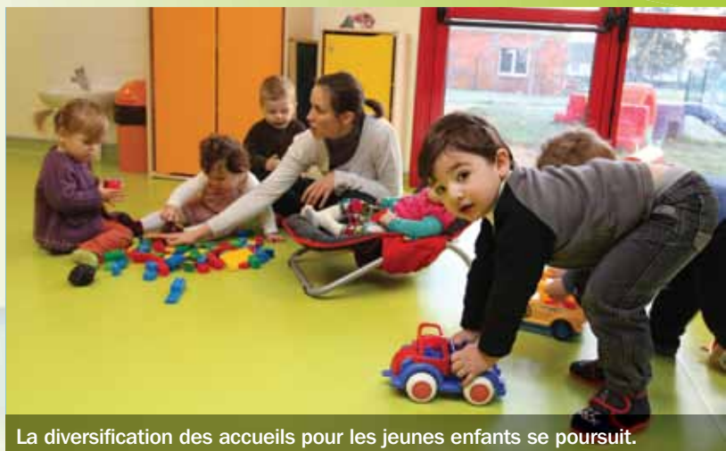
La diversification des accueils pour les jeunes enfants se poursuit.