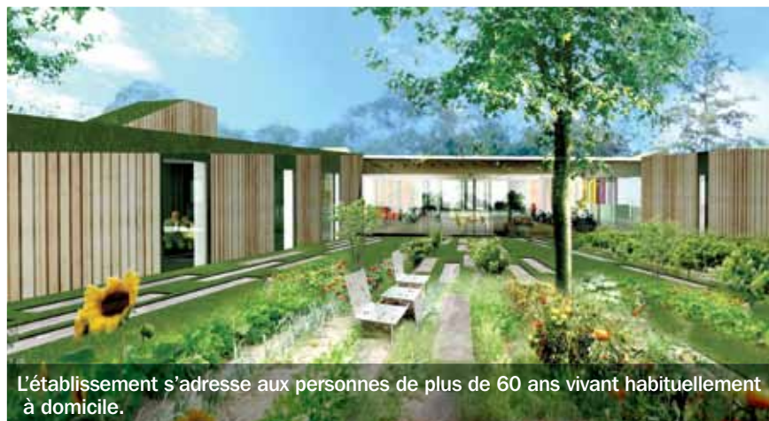
L'établissement s'adresse aux personnes de plus de 60 ans vivant habituellement à domicile.