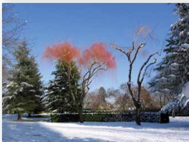
Solution page 34