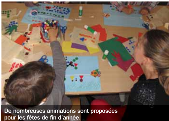
De nombreuses animations sont proposées pour les fêtes de fin d'année.

Pour ces fêtes de fin d'année, le mij (musée de l'illustration jeunesse) et le mab (musée Anne-de-Beaujeu) sortent de leur hotte une kyrielle d'animations. Au mij, les plus jeunes sont les rois de la fête. Les 4-6 ans sont attendus les 23 et 30 déc, dès 10 heures, pour des lectures et un atelier ; les 7-10 ans, le 24 déc, à 10 heures (lecture-atelier) et le 30 déc, à 14 h 30 (lectures). Le mab pense aussi aux enfants : les 4-6 ans sont invités à réaliser une carte de Noël, le 23 déc, à 14 h 30, et les 7-12 ans pourront participer à un atelier artistique les 23 et 30 déc, à 10 heures, ou à une visite-lecture, le 24 déc, à 14 h 30. Les réservations sont conseillées et une participation financière sera demandée pour les ateliers. Les grands seront également choyés au mab, le 17 déc, à 18 heures, avec une conférence de Neil Stratford, conservateur général émérite du British Museum, sur l'email de saint Joseph. Bien entendu, il est aussi possible de voir les expositions, de participer aux visites de la Maison Mantin... On peut même faire ses achats de Noël, puisque les musées déclinent de nombreux objets dérivés. ■ • mij, 36, rue Voltaire 03000 Moulins www.mij.allier.fr • mab, place du Colonel Laussedat, 03000 Moulins www.mab.allier.fr