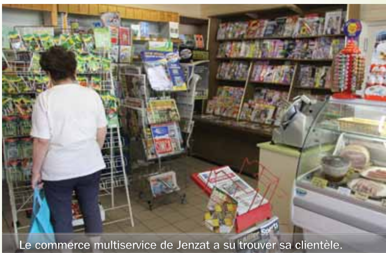
Le commerce multiservice de Jenzat a su trouver sa clientèle.

L'ensemble de ces points seront croisés avec les autres résultats du diagnostic conduit depuis plusieurs mois dans l'Allier. Le but est d'arriver à une photographie précise de la situation et d'apporter des réponses via le Schéma d'accessibilité des services au public.