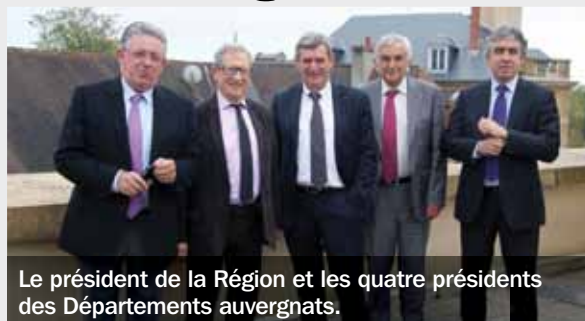
Le président de la Région et les quatre présidents des Départements auvergnats.

Le 27 octobre, le président de la Région et les quatre présidents des Départements qui la composent se sont retrouvés comme ils le font trois fois par an. Lors de cette rencontre, ils ont abordé des dossiers thématiques partagés tels que le Contrat de projet État-Région, le Très haut débit, les aides à l'agriculture en fonction des accords européens... Il a également été question du projet de réforme territoriale et de la fusion Rhône-Alpes/Auvergne. À cette occasion, plusieurs sujets ont été abordés : les perspectives de compétences avec une éventuelle délégation de la Région aux Départements, un futur mode de décision visant à préserver une représentation des Départements dans la grande Région, etc. Ces thèmes devraient être à nouveau débattus lors de leur prochain rendez-vous en janvier. ■