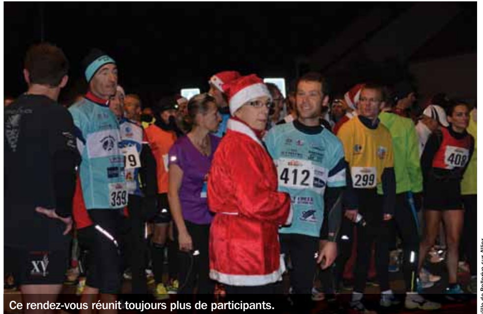
Ce rendez-vous réunit toujours plus de participants.

Le 20 décembre, enfilez vos déguisements de Père ou de Mère Noël et chaussez vos baskets. Bellerive-sur-Allier (au Cosec) organise la 5 e corrida « L'hivernale des Pères Noël ». En 2013, la manifestation a réuni plus de 300 participants, des férus de course à pied mais aussi des néophytes venus passer un bon moment. Comme l'an passé, les sportifs ont le choix entre trois circuits urbains chronométrés : 3 km (dès 15 ans), 4,5 km et 9 km (pour les + de 18 ans). Les premiers départs ont lieu à 17 h 30. Il est possible de s'inscrire auprès du service des sports de la Ville ou directement sur son site internet, www.ville-bellerive-sur-allier.fr , mais aussi le jour de la course, à partir de 15 heures. La présentation d'un certificat médical de moins d'un an ou d'une licence d'athlétisme en cours de validité est exigée. Tous les coureurs se retrouveront ensuite au marché de Noël (place de la Source