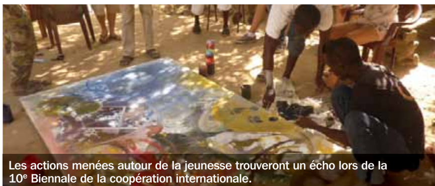
Les actions menées autour de la jeunesse trouveront un écho lors de la 10 e Biennale de la coopération internationale.

Le Département de l'Allier a franchi un pas de plus dans la coopération décentralisée avec la commune de Nguekokh (Sénégal). Il facilite ainsi les actions en direction de la jeunesse. En partenariat avec les comités de jumelage Teraanga France et Sénégal, la commune et le Pôle culturel et de loisirs (PCL) de Nguekokh mais aussi le centre social d'Ébreuil, les juniors associations Pari jeunes et la Maison du lycéen du lycée Théodore-de-Banville (Moulin), il encourage la formation dans l'animation interculturelle et l'accès au numérique. Ce projet, s'inscrivant sur plusieurs années et cofinancé par le ministère des Affaires étrangères,