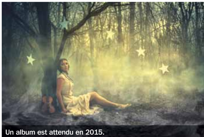
Un album est attendu en 2015.