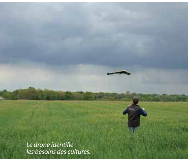
Le drone identifie les besoins des cultures.

Ces actions présentées sous une forme ludique sont très importantes : en effet, dans l'Allier, les 15-24 ans représentent 10 % de la population mais 22 % des tués dans les accidents de la route. ►