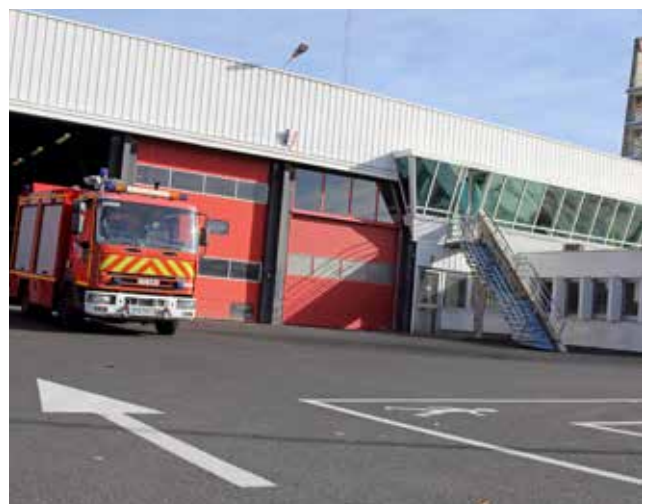
Le centre effectue plus de 5 000 interventions par an.

Ce chantier était très attendu, l'activité du centre progressant de manière constante ces dernières années. À l'heure où les statistiques 2017 s'affinent, en 2016 les sapeurs-pompiers de la caserne ont effectué 5 251 interventions, contre 4 623 en 2015. Plus de 70 % d'entre elles ont concerné les secours aux personnes, alors que les accidents de la route ont représenté 7,5 % de leurs sorties et les incendies 5,8 %.