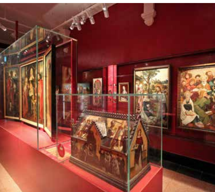
Une salle digne des plus grands musées.