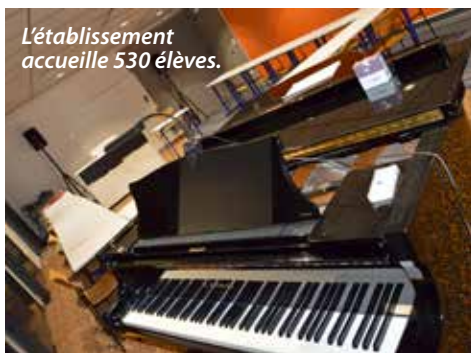
L'établissement accueille 530 élèves.

Moulins Communauté participe à la modernisation de ses équipements. Son école de musique de 530 élèves a bénéficié d'un profond lifting de 500 000 €. Le résultat est là : une entrée dans l'air du temps, deux nouvelles salles de cours collectifs, une autre agrandie à l'étage, un espace réaménagé pour les professeurs et des bureaux neufs pour l'administration. Mais derrière l'aspect esthétique se trouve avant tout une volonté pédagogique de l'école : elle souhaite renforcer la pratique instrumentale collective et la promotion des cuivres.