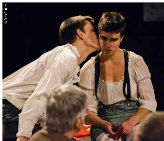
Le théâtre d'aujourd'hui s'ouvre au plus grand nombre.