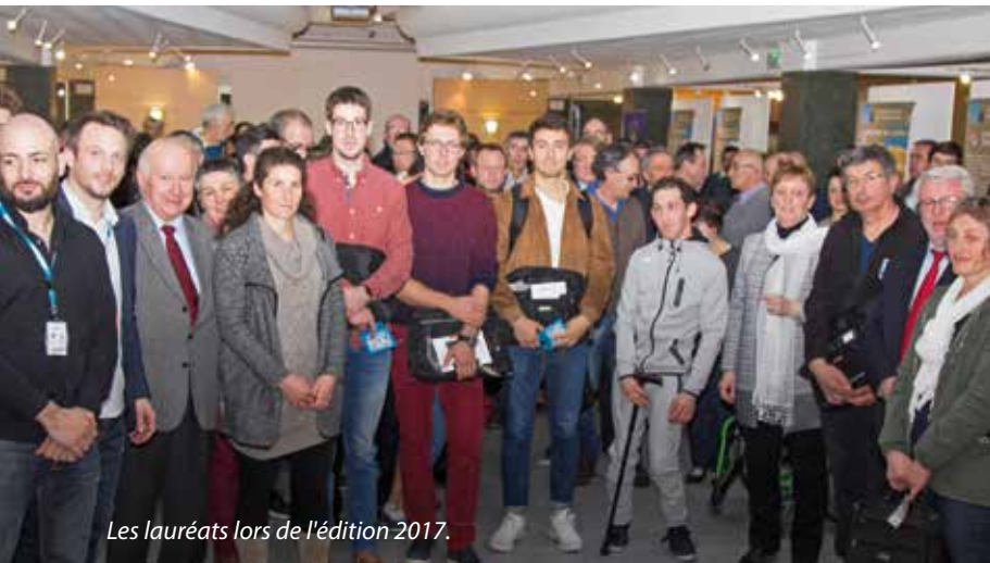
Les lauréats lors de l'édition 2017.