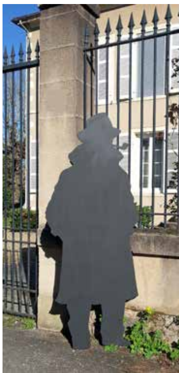
L'association renforce ses actions autour de l'auteur.