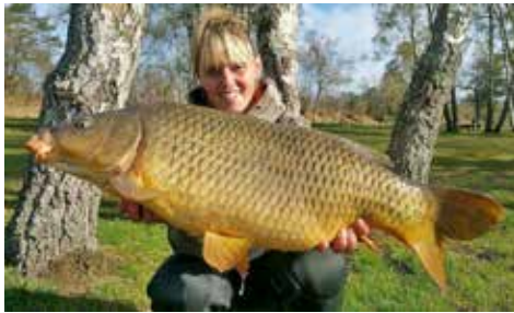
La manifestation s'affirme comme un rendez-vous incontournable pour tous les passionnés.