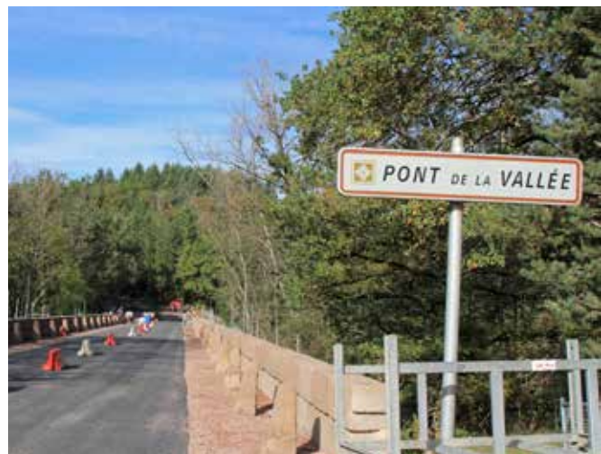
2 400 m 2 d'échafaudages ont été nécessaires à la réalisation des travaux.