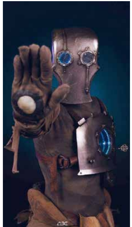
À vos déguisements !

C'est une première à Saint-Germain-des-Fossés. Les 27 et 28 janvier, la maison des jeunes, en partenariat avec la Ville, organise le Game Show. Pendant deux jours, l'espace culturel Fernand-Raynaud sera l'ancre foisonnant de la culture geek. Les passionnés de mangas, de comics, de jeux vidéo, de rétro-gaming, de séries télé et de science-fiction trouveront forcément leur bonheur lors de cette convention. Le programme a de quoi les séduire : défilé de costumes, essais et démonstrations de jeux, stands d'éditeurs et d'artistes, dédicaces, concerts, conférences, expositions, combats au sabre laser, ateliers, concours de Bomberman France (jeu vidéo), etc. Pour le prix symbolique d'une entrée, il sera possible de vivre une expérience totalement inédite dans la ville. ▶