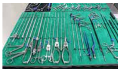
L'entreprise fabrique des instruments de chirurgie.