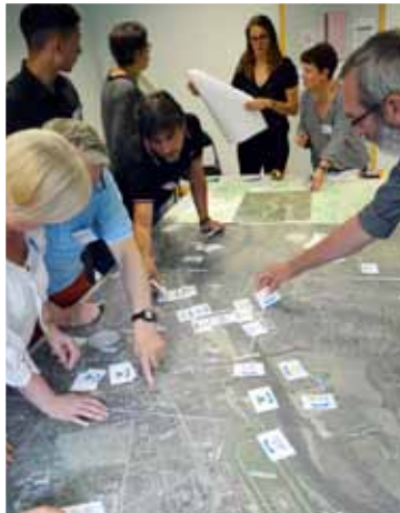
Des concertations ont été organisées avec les habitants.

de la rivière, un nouvel espace de baignade, des aires de jeux, des parcours sportifs, des sentiers de promenade et d'interprétation, des espaces événementiels éphémères... À terme, il sera possible d'aller à pied ou à vélo, du sud de Toulon-d'Allier au nord d'Avermes. Le projet au long cours s'inscrit plus largement dans celui du Département sur l'axe Allier.