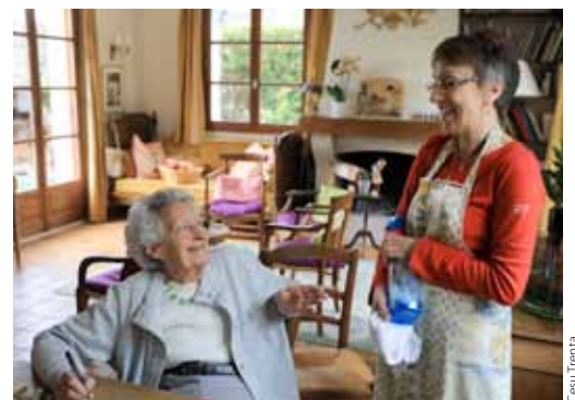
Les accueillants familiaux se déclarent désormais sur www.cesu.urssaf.fr .