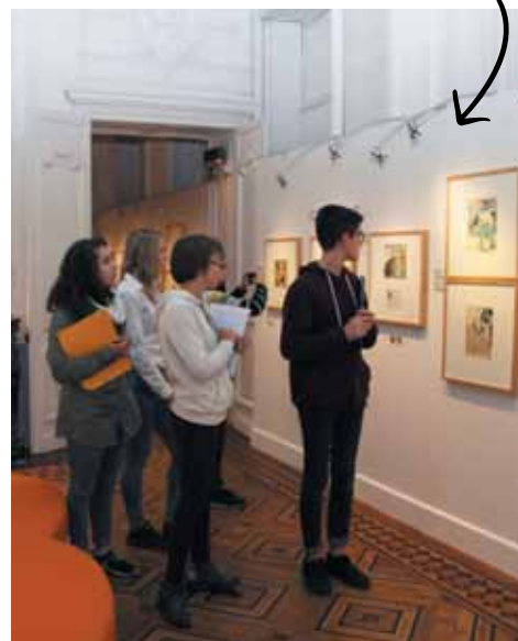
Près de 500 élèves sont associés au projet.

Comment conduire les adolescents à s'intéresser à la culture ? En parallèle aux actions menées dans les établissements, le Conseil départemental a décidé de relever le défi en créant « Culture collège ». Pendant l'année scolaire, à la suite d'un appel à projets, près de 500 élèves, en classe de 5 e , 4 e ou 3 e , ainsi qu'en SEGPA, découvrent les métiers liés aux arts, au moment de leur vie où ils sont conduits à effectuer leurs premiers choix d'orientation. Ils sont accompagnés par des acteurs culturels reconnus : le CDN, Théâtre des Îlets, et le 109, la Cie Attrape-Sourire et l'association M-Rod. En fonction de leur collège de rattachement, ils se familiarisent avec le théâtre, les musiques actuelles ou le street art. Ils mettent les mains dans le cambouis en s'impliquant dans des créations. Ils s'imprègnent de l'envers du décor en partant à la rencontre des petites mains de l'expression artistique. L'opération, d'un montant de 20 000 €, relève du gagnant-gagnant. Les jeunes éveillent leur curiosité en se familiarisant avec un univers dont ils peuvent parfois être très éloignés. Quant aux professionnels du monde culturel, ils croisent un public habituellement difficile à capter.