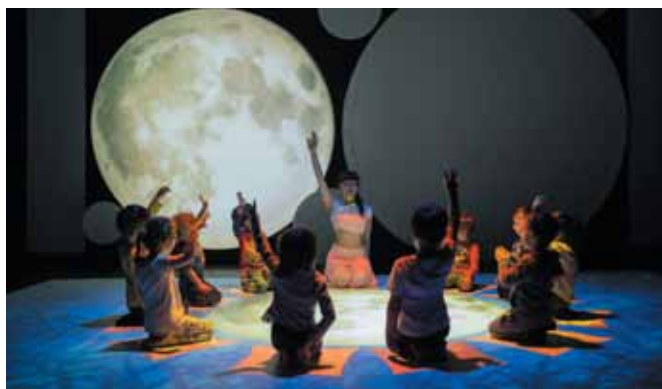
« La Maison du panda » livrera ses secrets les plus oniriques.

Du haut de ses 4 ans, il a tout d'un grand. « Coup de projecteur » reprend du service du 25 au 27 janvier, à Bellerive-sur-Allier. Un riche programme tient le haut de l'affiche du festival du film d'animation organisé par la Ville. Enfants et adultes peuvent assister à des projections, à des représentations mais aussi participer à des ateliers et des rencontres avec des professionnels. Les spectacles vivants jalonnent l'événement. Ainsi, il débutera en poésie, vendredi 25, à 20 heures, avec une lecture musicale dessinée autour du « Vilain petit canard » et une série de courts-métrages. Le lendemain, samedi 26, les familles sont attendues au Geyser, dès 15 h 30, pour une battle géante de dessins et, à 17 h 30, au le spectacle musical dessiné « Renard et Loup ». Dimanche 27, à 11 et 16 heures, le Geyser accueille également un moment hors du temps avec la Cie TPO, dans une performance numérique bluffante « La Maison du Panda ». La médiathèque-ferme modèle s'associe aussi à l'événement, en