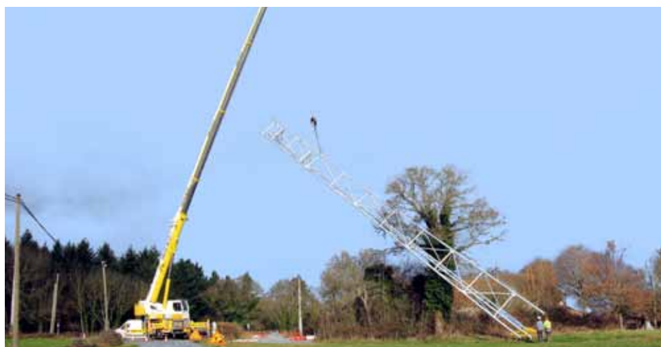
Installation d'un pylône à Saint-Christophe.

Un partenariat avec l'Auvergne-Rhône-Alpes va également permettre de couvrir une partie de la Haute Vallée du Cher, impactant Saint-Marcel-en-Marcillat, La Petite-Marche et Mazirat. Ce même programme concernera aussi les gorges de la Sioule et Châtel-Montagne.