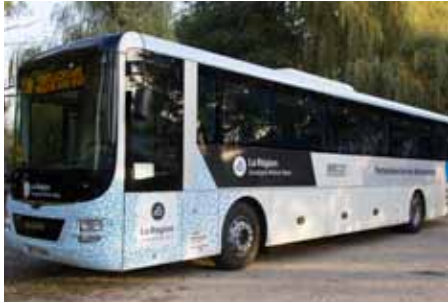
Les bus des lignes régulières ont un nouvel habillage.

La Région a souhaité que le Conseil départemental continue de gérer les lignes de transport en commun dans l'Allier. Il y a quelques semaines,