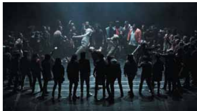
Clément Cogitore expose avec 9 autres artistes.

Jusqu'au 22 mars, Eroa, l'Espace de rencontre avec l'œuvre d'art, du lycée Jean-Monnet, à Yzeure, abrite une exposition du Frac, Fonds régional d'art contemporain. Sous le nom « Les Mondes invisibles », elle donne à voir des œuvres originales de 10 artistes (Almond, Cogitore, Cordesse, Dallaporta, Eustache, Fromanger, Gonnord, Kahrs, Mouraud, Sperini). Peintures, photographies, sculptures, toutes interpellent le visiteur et parfois le dérange dans ses certitudes. L'exposition est visible du lun. au ven. de 8 à 18 h (mer. et ven. fermeture à 17 h ; jeu. et ven. fermée de 12 h à 13 h).