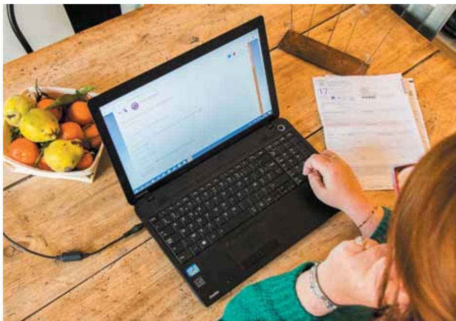
Depuis le 1 er janvier, le dépôt de dossier Anah se réalise obligatoirement sur internet.

Pour toute question sur l'habitat et afin de faciliter les démarches, le Point rénovation info service (Pris) du Conseil départemental poursuit son accompagnement : tél. 04 70 34 41 84 ou pris03@allier.fr (attention, il est là pour orienter et conseiller, il ne peut en aucun cas « faire à la place de »).