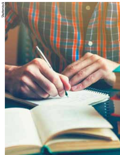
« Viens voir les comédiens » a été retenu comme thème.

L'Allier est une terre littéraire. Depuis un quart de siècle, le Concours Bourbonnois s'épanouit généreusement dans son sillon. Porté par le Nabab, Noyau d'animation de Bourbon-l'Archambault, avec le soutien technique de la médiathèque communale, l'événement municipal est devenu une référence, décrochant le label de la Société des gens de lettres et le soutien de la délégation à la francophonie. Pour fêter dignement son 25 e anniversaire, le concours d'écriture, ouvert jusqu'au 16 mars, a noué un partenariat inédit avec le CNC, Centre national du costume de scène, et a retenu le thème à propos « Viens voir les comédiens ». Si la participation est gratuite, les prix attribués par le jury sont dotés de 1 300 €, répartis entre les lauréats. Il n'y a plus qu'à tailler ses crayons et aiguïser sa plume !