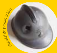
Portrait du paysan soldat

Samedi 26 janvier, de 9 à 17 heures, dans l'Allier, chaque MFR (Maison familiale rurale), ouvre ses portes à l'occasion de la Journée des talents. La manifestation met en lumière l'enseignement dispensé et les différentes filières. Les élèves s'impliquent en proposant diverses animations : démonstration de forge, soins aux bébés et aux adultes en perte d'autonomie, ateliers cuisine, couture, vente, accueil, témoignages... www.ecolealternance.com