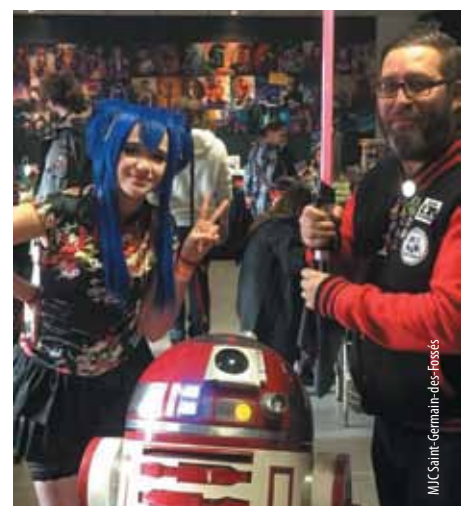
Les cosplayers sont les bienvenus.