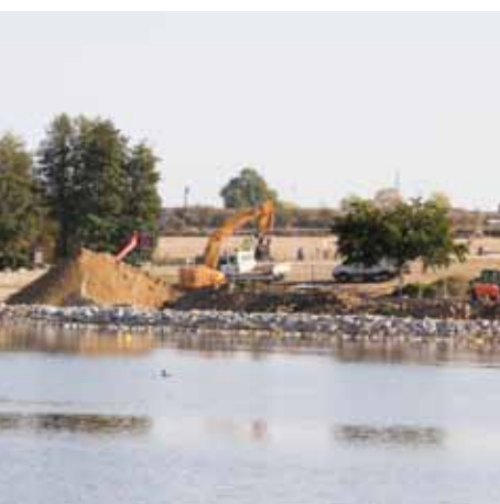
De nouvelles activités sont proposées.

Le plan d'eau des Ozières, à Yzeure, est plongé dans une profonde mutation. Les employés communaux, avec le soutien d'entreprises extérieures s'affairent pour que le site entièrement repensé soit accessible dès l'été prochain. De nouvelles activités seront proposées : jeux d'eau en brumisateurs, agrès, accrobranche, restauration... Des aménagements complémentaires permettront l'accueil de rendez-vous culturels.