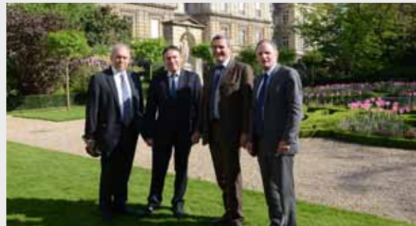
Conseil général de la Nièvre