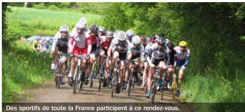
Des sportifs de toute la France participent à ce rendez-vous.

Pour sa 6 e édition, du 9 au 11 mai, la course cycliste Ufolep Sur les routes du Bourbonnais trace son sillon dans la Combraille ainsi que dans les régions de Commeny et de Nérès-les-Bains. Le comité d'organisation, soutenu par le Conseil général, a défini quatre étapes : vendredi 9, course en ligne à Durdat-Larequille (66 km – 18 h) ; samedi 10, course en ligne à Nérès-les-Bains (77 km – 9 h 30) et contre-la-montre individuel à Commeny (11,4 km – dès 15 h 30) ; dimanche 11, course en ligne à Marçillat-en-Combraille (87 km – 9 h 30). Ce rendez-vous sportif est ouvert aux cyclistes des catégories 1-2 et 3 Ufolep. Il devrait réunir une centaine de participants dont des fidèles ainsi que des équipes du Var, des Bouches-du-Rhône, de l'Oise, des Yvelines et des Deux-Sèvres. ■