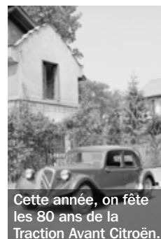
Cette année, on fête les 80 ans de la Traction Avant Citroën.

Le Rétro Mobil' en Boudeville fête le 29 mai un double anniversaire : la 20 e édition de la manifestation et les 80 ans de la Traction Avant Citroën. Pour cet événement exceptionnel, le Rétro mobile club dompierrois s'est associé au Club de la traction universelle Centre et à Citroën Héritage pour proposer un programme bien huilé : rassemblement de véhicules anciens (autos, motos, poids lourds, utilitaires, tracteurs...), bourse aux pièces, miniatures, documentation, animations, etc., le tout dans le cadre enchanteur du parc de la Roseraie et de l'Espace Boudeville. Un rendez-vous gratuit sur lequel les amoureux de belles mécaniques anciennes doivent impérativement embrayer. ■