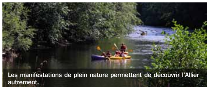
Les manifestations de plein nature permettent de découvrir l'Allier autrement.

Allier, grâce à son patrimoine naturel, offre la possibilité de pratiquer de multiples activités de pleine nature : accrobranche, VTT, randonnée, tir à l'arc, canoë, équitation, pêche... Découvrez-les lors d'Écolette, le 15 juin, au domaine des Grandes Côtes à Target, de 10 à 18 heures et testez votre précision avec le disc golf. Si vous êtes plutôt agile, le 22 juin, de 10 à 19 heures, rendez-vous à Ferrières-sur-Sichon et essayez la grimpe urbaine lors de DécouVERTE ou partez à la chasse aux « caches » avec le géocaching. Ces deux manifestations ouvertes au grand public proposent également des journées dédiées aux scolaires de la maternelle au lycée. D'ailleurs, du 19 au 23 mai, la forêt de Tronçais deviendra le terrain de jeu à taille réelle de centaines d'élèves à l'occasion d'Oxygène. Le Département soutient l'ensemble de ces événements. ■