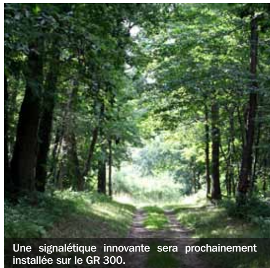
Une signalétique innovante sera prochainement installée sur le GR 300.

De Château-sur-Allier à Ébreuil, le GR 300 s'étend sur 135 km dans l'Allier. Reconnu par l'Association compostelane interrégionale (Acir), il permet de relier deux grands itinéraires de Saint-Jacques-de-Compostelle en France (la voie de Vézelay et la voie du Puy-en-Velay). Désormais pleinement reconnu au niveau départemental, il fait l'objet d'une attention toute particulière. Ainsi, le Conseil général a décidé de s'associer aux étudiants en BTS design et de l'École nationale du verre du lycée professionnel Jean-Monnet d'Yzeure pour concevoir une signalétique innovante et visible par tous les types de randonneurs (à pied, en vélo ou à cheval), en neuf points remarquables du parcours. Le premier panneau sera inauguré le 29 juin, à Château-sur-Allier, à l'occasion de L'Échappée verte, nouvelle grande fête de randonnée dans l'Allier. ■