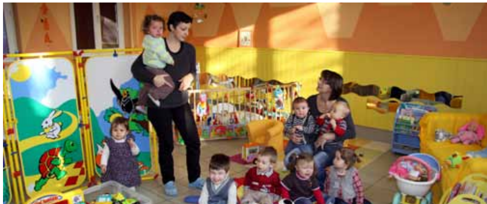
Les maisons d'assistantes maternelles sont en plein développement dans l'Allier.

L'Allier compte 2 372 assistant(e)s maternel(le)s pour 8 085 places d'accueil. Voici quelques informations à retenir avant de se lancer dans ce métier en pleine voie de professionnalisation.