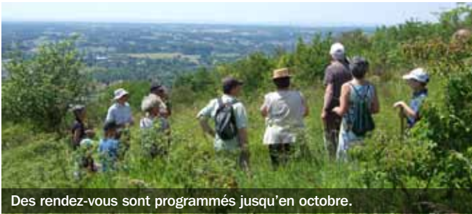
Des rendez-vous sont programmés jusqu'en octobre.

Dans l'Allier, pas besoin d'être un grand naturaliste pour apprécier la nature dans toute sa diversité. Il existe même un événement qui ouvre un large champ des possibles : Les balades nature . Organisées pendant toute la belle saison jusqu'au mois d'octobre, elles se déclinent en une quarantaine de rendez-vous dans les onze sites labellisés Espaces naturels sensibles (ENS) du département. Ici, pas question de suivre l'exposé d'un intervenant poussiéreux : la nature se découvre au fil d'une promenade contée, au gré de notes de musique, lors de sorties nocturnes... Il suffit d'être bien équipé ! L'ambiance est toujours conviviale et ludique pour une approche culturelle ou scientifique accessible à tous et même aux plus petits. Si Les balades nature relèvent d'une initiative du Conseil général, les communautés de communes les orchestrent. Leur programme complet est disponible auprès des offices de tourisme de l'Allier ainsi que chez des prestataires touristiques. Il est également possible de le consulter en se connectant sur le site internet du Département, www.allier.fr > Découverte > Nature. ■