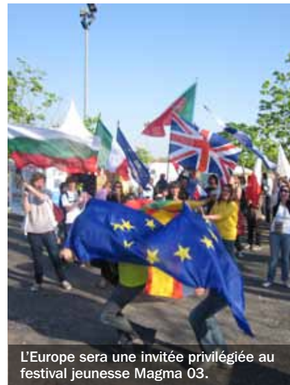
L'Europe sera une invitée privilégiée au festival jeunesse Magma 03.

Europe Direct Allier, Hôtel du Département 1 av. Victor-Hugo 03000 Moulins tél. 04 70 34 16 50 ou europedirect@cg03.fr