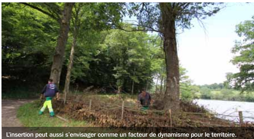
L'insertion peut aussi s'envisager comme un facteur de dynamisme pour le territoire.

Pour réussir la mise en œuvre de ces actions, un partenariat fort continue de se nouer avec l'ensemble