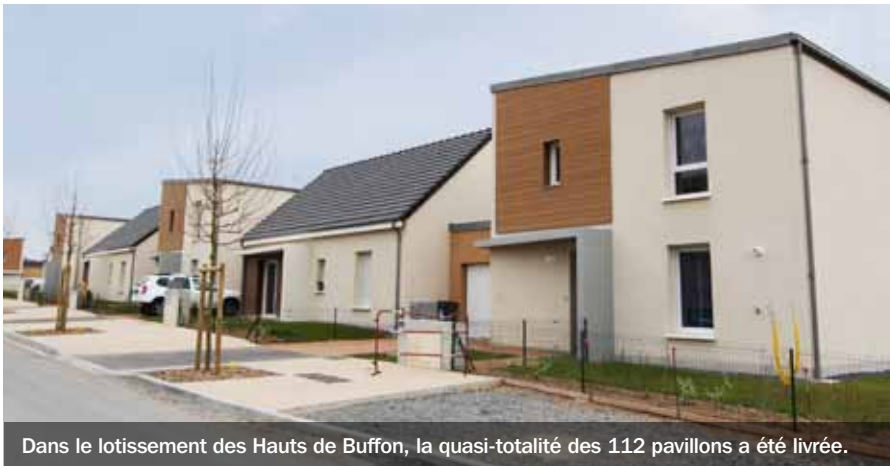
Dans le lotissement des Hauts de Buffon, la quasi-totalité des 112 pavillons a été livrée.

Le programme Anru (Agence nationale pour la rénovation urbaine) de Montluçon se poursuit dans les quartiers de la ville. Fontbouillant bénéficie de l'aménagement d'îlots fonciers qui permettront d'accueillir prochainement une quinzaine de pavillons. Quant au centre commercial, il reprend vie avec la réouverture d'une boulangerie et d'une surface alimentaire. D'ici quelques mois, un café et une solderie les rejoindront. En parallèle, la quasi-totalité des 112 pavillons du lotissement des Hauts de Buffon a été livrée et beaucoup sont déjà habités.