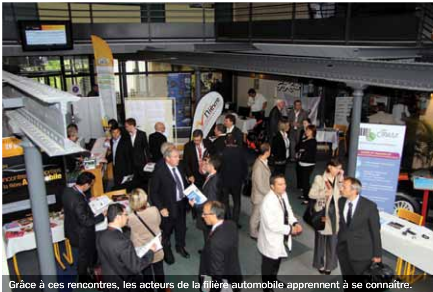
Grâce à ces rencontres, les acteurs de la filière automobile apprennent à se connaître.

Dans un marché de l'automobile en crise, dont la stratégie se décline désormais à l'échelle européenne, les Départements de l'Allier, de la Nièvre, du Cher et de la Creuse se sont fédérés afin d'organiser les Rencontres entreprises de la filière automobile. L'organisation de l'événement est confiée au Comité d'expansion économique de l'Allier (CEEA), en lien avec ses partenaires locaux, dont la Communauté d'agglomération montluçonnaise et la Chambre de commerce de Montluçon-Gannat.