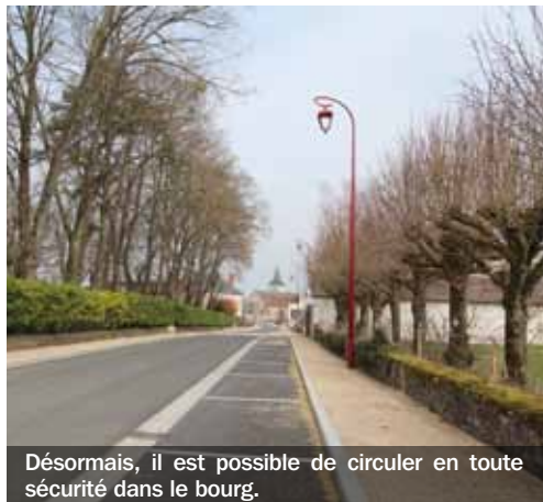
Désormais, il est possible de circuler en toute sécurité dans le bourg.