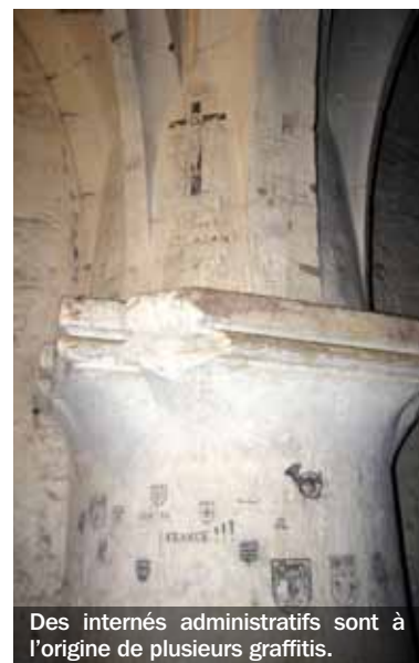
Des internés administratifs sont à l'origine de plusieurs graffitis.

collaboration. Cette révélation vient contrecarrer les idées reçues selon lesquelles il s'agissait de graffitis des prisonniers de la Wehrmacht. Devant l'importance de ces témoignages et de leur fragilité due à des infiltrations, la Direction régionale des affaires culturelles (DRAC) Auvergne a décidé de les préserver, en vue d'une prochaine restauration. Ces éléments seront à découvrir lors de l'ouverture estivale de la Mal Coiffée. Cette année, l'accent sera mis sur la Seconde Guerre mondiale et la Libération grâce notamment à des planches de photos inédites dernièrement confiées aux Archives départementales. ■