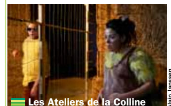
Les Ateliers de la Colline

18 mai à 16 h // Le Geysier Jeune Public > 04 70 32 95 13