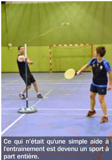
Ce qui n'était qu'une simple aide à l'entraînement est devenu un sport à part entière.

Souvenez-vous... Le speed-ball est apparu dans les années 1960. Au départ, il s'agit d'entraîner les joueurs de tennis débutant grâce à une balle creuse en caoutchouc qui tourne autour d'un mât métallique accroché par un fil de nylon. Aujourd'hui, c'est un sport à part entière. L'Association nature, culture, sports, loisirs de Montluçon a décidé de mieux le faire connaître dans l'Allier en accueillant les 24 et 25 mai, le 29 e