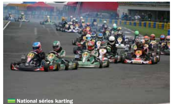
■ National séries karting