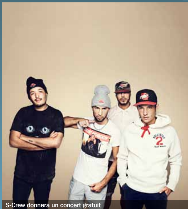
S-Crew donnera un concert gratuit

Pour ne pas s'égarer sur la route des idées préconçues et en apprendre plus sur les nombreuses actions de prévention mises en place dans le