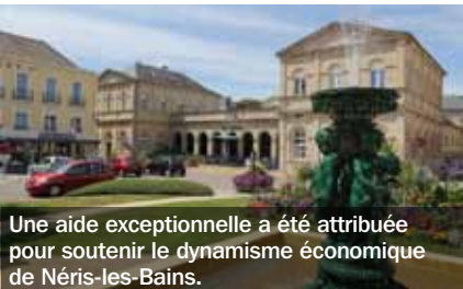
Une aide exceptionnelle a été attribuée pour soutenir le dynamisme économique de Nérès-les-Bains.

Le développement économique étant un objectif central du Conseil général, la commission permanente a accordé une aide de 200 000 € à PL Rechapage, éco-entreprise basée à Avermes, afin de l'aider à développer ses activités et permettre la création de quatre emplois. Elle a également voté une aide exceptionnelle de 87 000 € pour soutenir les commerçants, artisans et loueurs de meublés professionnels de Nérès-les-Bains, qui rencontrent des difficultés