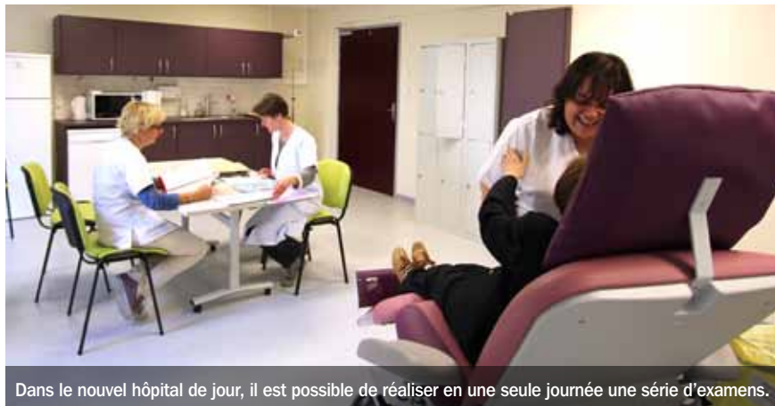
Dans le nouvel hôpital de jour, il est possible de réaliser en une seule journée une série d'exams.

Ainsi, en relation avec son médecin traitant et les familles, les assistants sociaux, le Clic et les services du Conseil général, la personne âgée peut bénéficier d'une hospitalisation programmée dans un service adapté au grand âge. Cela peut se