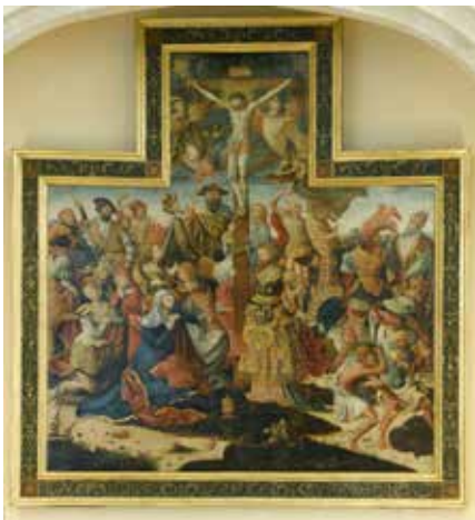
Le mab a été récompensé pour la restauration de sa collection de peintures sur bois des XV e et XVI e siècles.