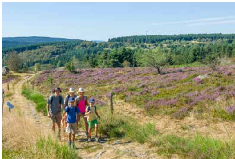
Plateau de la Verrière à Saint-Nicolas-des-Biefs

Plus des 2/3 des professionnels du tourisme de l'Allier sont satisfaits de la saison touristique 2016. En dépit d'un contexte difficile, avec un net recul de la fréquentation internationale, les chiffres d'affaires restent stables et sont souvent meilleurs qu'en 2015 pour 78 % des prestataires de l'Allier (- 10 points pour l'Auvergne).