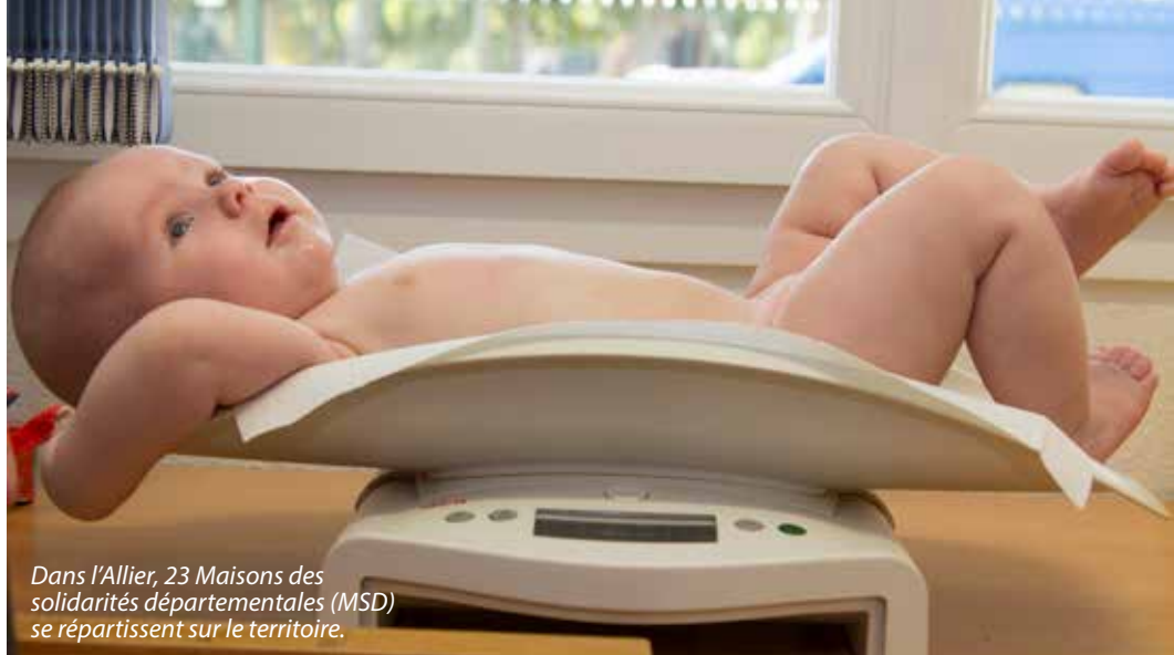
Dans l'Allier, 23 Maisons des solidarités départementales (MSD) se répartissent sur le territoire.

En ce début d'année, le Département accueille deux jeunes bourbonnais en service civique. Ils viennent renforcer l'accompagnement des actions du Conseil Départemental des jeunes et de Pari Jeunes, association permettant aux anciens élus mineurs de poursuivre leur engagement citoyen. Ces deux volontaires travailleront 24 heures par semaine et, en échange de leur investissement, recevront des indemnités. Leur mission, dont une partie sera orientée vers l'éveil culturel, constituera une nouvelle expérience qu'ils pourront ensuite valoriser au niveau professionnel.