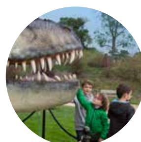
PALÉOPOLIS (Gannat) 35 236 visiteurs