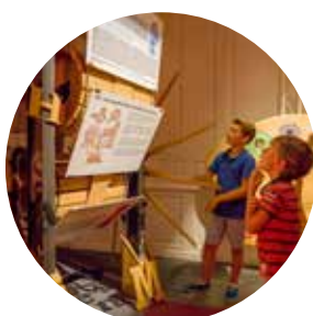
MIJ (Moulins) 17 579 visiteurs