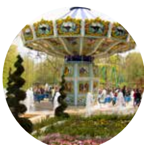
LE PAL (Saint-Pourçain-sur-Besbre) 572 000 visiteurs

▶ PLUS D'INFOS 04 70 46 81 50 www.allier-tourisme.com