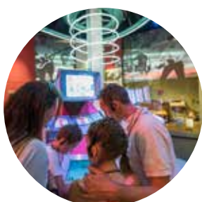
MUPOP (Montluçon) 25 030 visiteurs