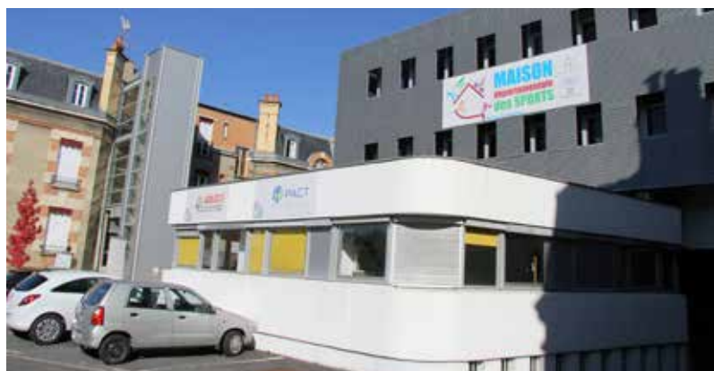
La Maison des sports se situe à Moulins.

allier.fr – 04 70 35 72 41 (Département) ou 04 70 47 18 71 (Cdos)