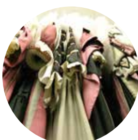
CNCS (Moulins) 60 488 visiteurs