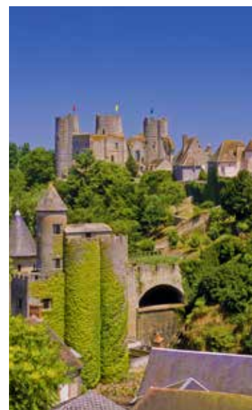
Château de Bourbon-Archambault

Hier comme aujourd'hui, le panel des actions du CDT le place au cœur de l'économie touristique du territoire, qui représente plus de 4 500 emplois. ▶