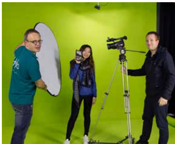
La Mission accueil du Conseil Départemental a accompagné la création de l'entreprise.

« Notre siège se trouve dans les locaux de l'association Studio 24,