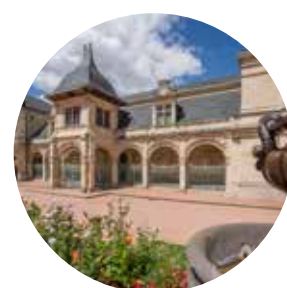
MAB/MAISON MANTIN (Moulins) 23 635 visiteurs