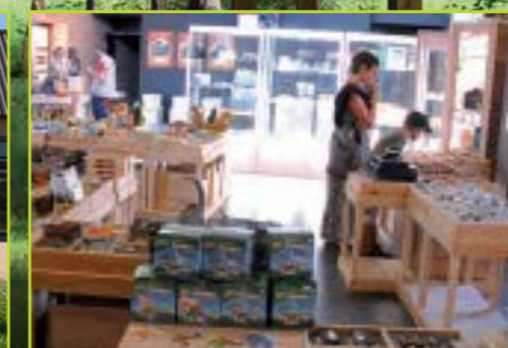
LA PALÉO BOUTIQUE